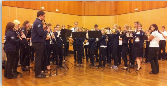
Orchester siegen beim Wertungsspiel