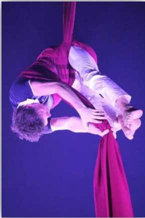
Besuch der Turnfestgala