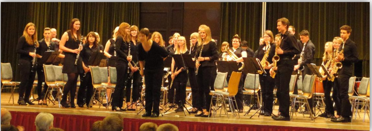
Das Jugendblasorchester beim Wertungsspielen in Friedberg

Gleich nach dem Konzert ging es für das Jugendblasorchester und das Blasorchester zum Wertungsspielen nach Friedberg. Beide Orchester erreichten jeweils in ihrer Stufe den ersten Platz