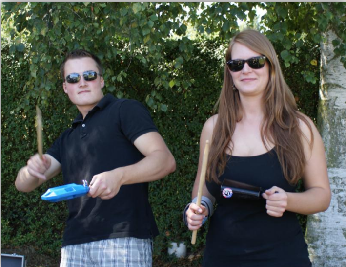
Rhythmische Einlage beim Familientag